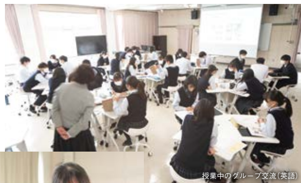
授業中のグループ交流(英語)

課題設定から分析・発表まで行う探究的学習を取り入れています。仲間と協力したり、自分で考えて伝えたりする機会が多く、大人になっても役立つ思考力・コミュニケーション力が身につきます。