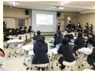
高校教育シンポジウム