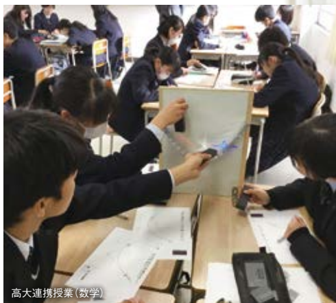
高大連携授業（数学）

愛知教育大学との連携により、大学教員が高校生向けの授業をすることも。大学レベルの研究に早い段階から触れ、知的好奇心を刺激します。