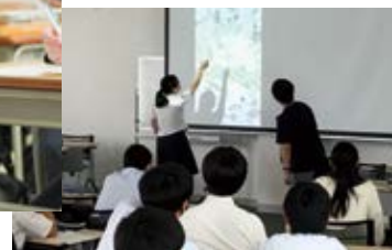
愛教大SEHプロジェクト詳細はp.4へ