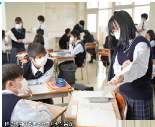
持ち時間の決まったプレゼン実習

課題設定から分析・発表まで行う探究的学習を取り入れています。仲間と協力したり、自分で考えて伝えたりする機会が多く、大人になっても役立つ思考力・コミュニケーション力が身につきます。